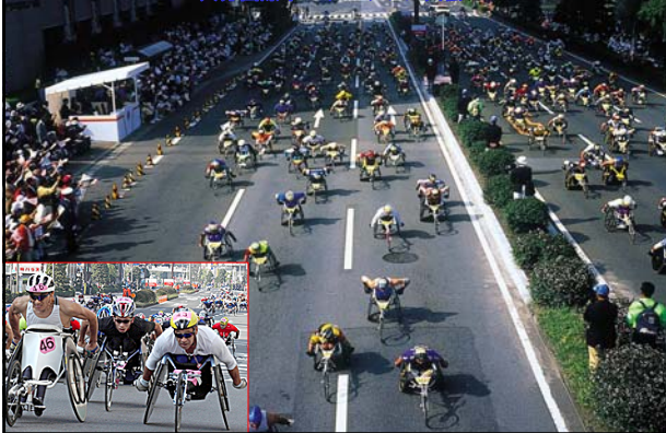
Oita International Wheelchair Marathon 大分国際車いすマラソン大会