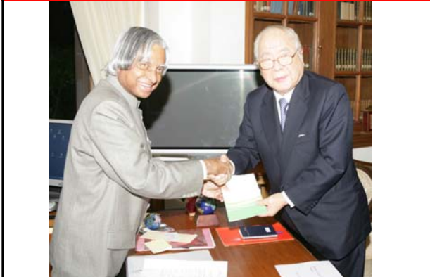
インド国アブドゥル カラーム大統領と会見(2007年2月14日) Meeting with Dr. Abdul Kalam, President of India (2007, Feb.)